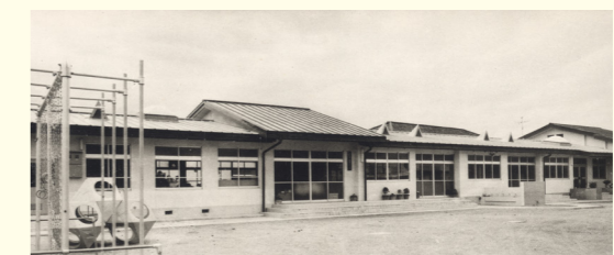
昭和49年 香芝町立 志都美保育所 当時