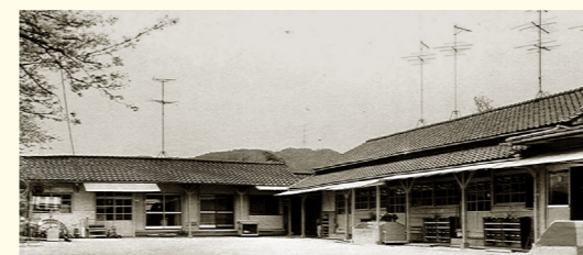
昭和50年代 香芝町立 関屋保育所 当時

関屋保育園・志都美保育園は幼保連携型認定こども園「関屋こども園」「志都美こども園」として生まれ変わりました。